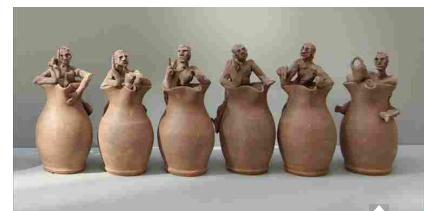
“Recipère”, in mostra «la quartara, il rizzulo, la rasola e la cornucopia»