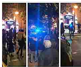
Affetta da disturbi psichici e ubriaca invece contro i passanti e le Forze...