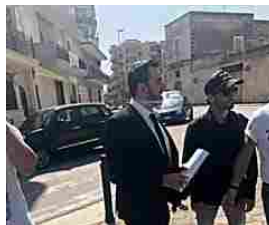
Le lene tornano ad Andria