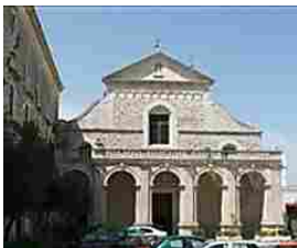
Non ce la fa il piccolo investito martedì sera nella periferia di Andria