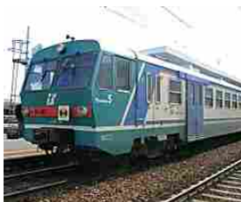
Incidente sulla tratta Monopoli-Fasano: è una donna la vittima