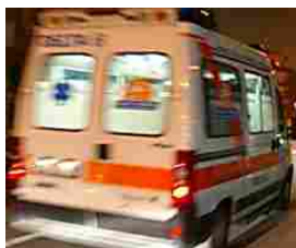
Incidente all'alba: muore giovane fasanese di 20 anni