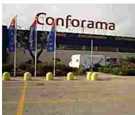
Furto al centro commerciale Conforama, denunciate tre persone