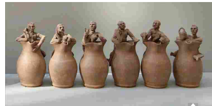
"Recipere", in mostra «la quartara, il rizzulo, la rasola e la cornucopia»