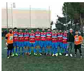
Dream Team: la battaglia per il terzo posto