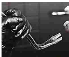
Arrestati due topi d'appartamento