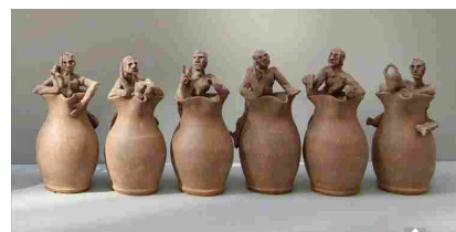
"Recipere", in mostra «la quartara, il rizzulo, la rasola e la cornucopia»