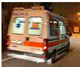
Muore in spiaggia a Trani un 36enne di Barletta