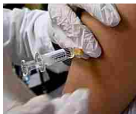
Danni da vaccino, famiglia tranese risarcita per due milioni di euro