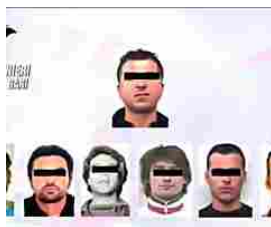
Giro di estorsioni, anche il Tribunale di Trani chiede condanne