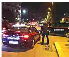
Le mani dei clan baresi su Terlizzi. I nomi degli arrestati Video