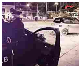
Detenzione e spaccio di droga, arrestato un terlizzone