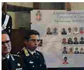
Smantellato traffico di droga in provincia. Raffica di arresti, uno a Terlizzi Video