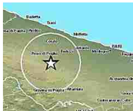
Terremoto questa mattina con epicentro Ruvo di Puglia Le foto