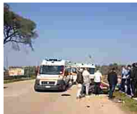
Incidente sulla Bisceglie-Corato. Muore un 23enne ruvese. Le immagini