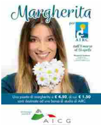
la locandina dell' iniziativa benefica

E lo fanno ancora una volta scegliendo la margherita , fiore della purezza per eccellenza e prodotto made in Italy al 100%.